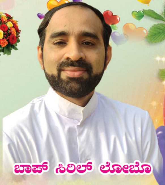
ಬಾಪ್ ಸಿರಿಲ್ ಲೋಹೊ